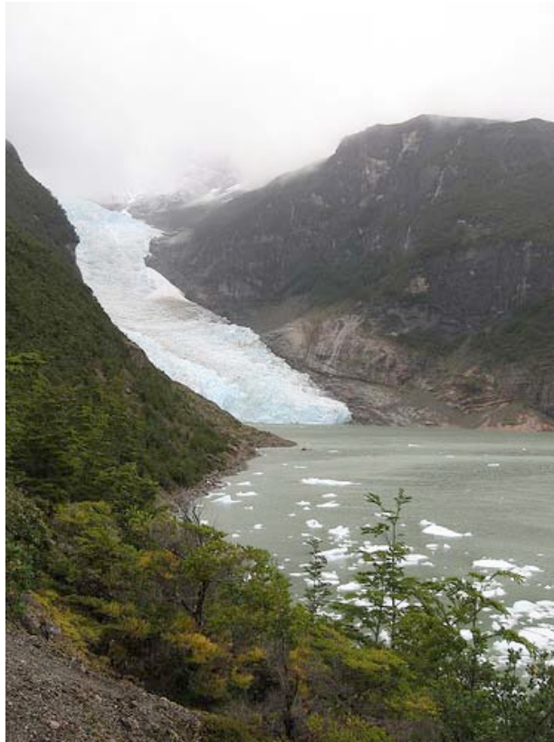
“Le Glacier Balmaceda”