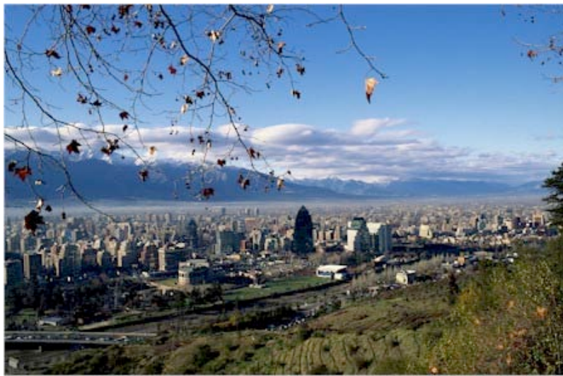
Santiago du Chili