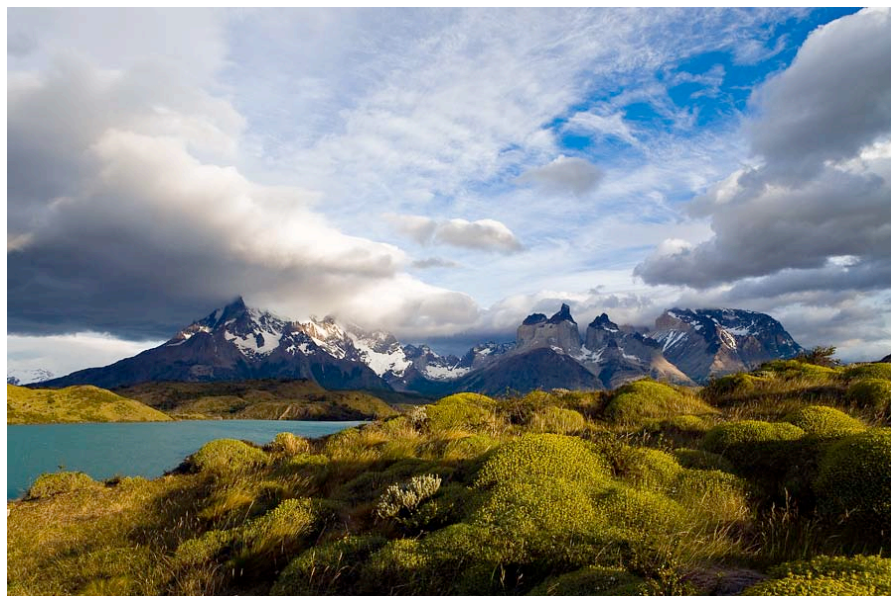
« Torres del Paine »