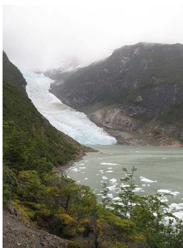
Le Glacier Balmaceda