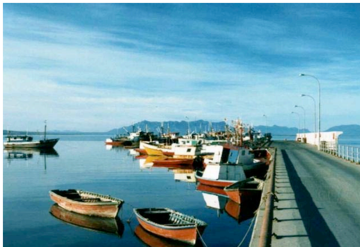
Le port de Puerto Natales