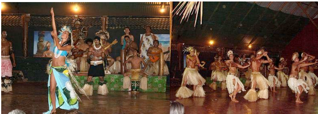
“Ballet Kari Kari”