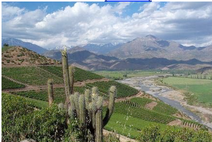
“Viña San Esteban”