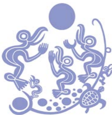
« Tangata Manu »